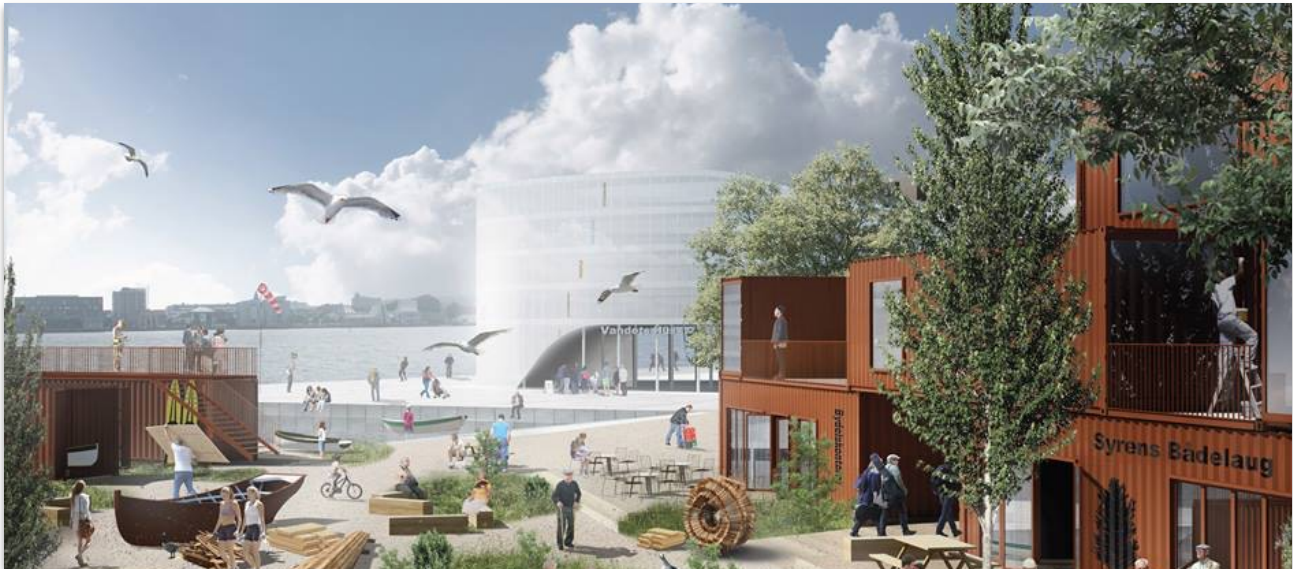
Illustration: Team Transform & Sleth

Stigsborg Havnefront som rummer i alt 54 hektar, er et af Danmarks største kystnære udviklingsområde. Området strækker sig fra Limfjordsbroen i vest, og langs Limfjorden til Limfjordstunnelen i øst.