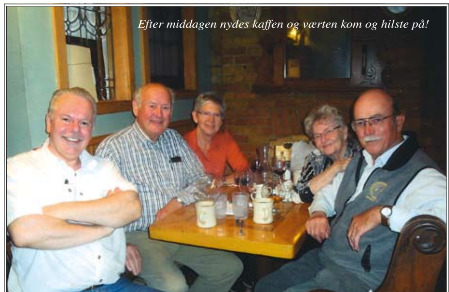
Efter middagen nydes kaffen og værten kom og hilste på!