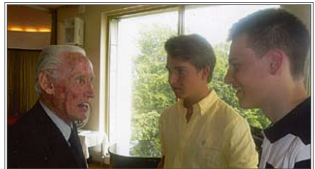
3 gamle Herlovianere: