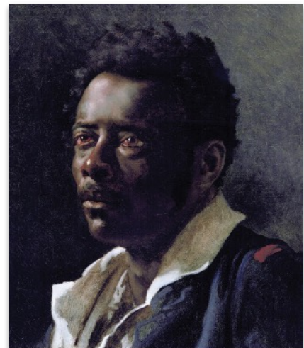
HARRIET BEECHER STOWE

mængde sprog. Romanen berettede om slaveriet i sydstatene i dets allerværste form, og viste hvor uadskillelig menneskelig grusomhed var fra slaveriinstitutionen, samt hvor fundamentalt uforenelige frie samfund og Sydens slavesamfund var. Blandt de temaer i romanen, der – foruden volden og grusomhederne - gjorde dybest indtryk, var de malende skildringer af de brutale familieadskillelser, som fandt sted. De yderst følelsesbetonede scener, som f.eks. da Eliza flygter over isen på Ohio-floden for at redde sin søn fra slavehandleren, eller da Tom hulkende må efterlade sine børn i Kentucky, fordi han bliver solgt til Syden, fik tårerne til at rulle på titusinder af læsere. Bogen fik umådelig stor betydning for den offentlige mening overalt udenfor Syden. Det fortælles, at da H. Beecher Stowe engang var indbudt til at møde Lincoln i det Hvide Hus, modtog han hende med ordene: "Så dette er altså den lille dame, der har fået krigen til at bryde ud". Forfatterinden skal godt nok ikke tildeles ansvaret herfor, men bogen vakte vældige følelser og fik derigennem vidtgående politiske konsekvenser. Den blev en slags bibel for slaverumodstandere overalt i verden og var stærkt medvirkende til at give det nystiftede Republikanske parti en hurtig og stærk fremgang.